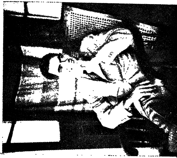
यशपाल जेल से रिहाई के समय